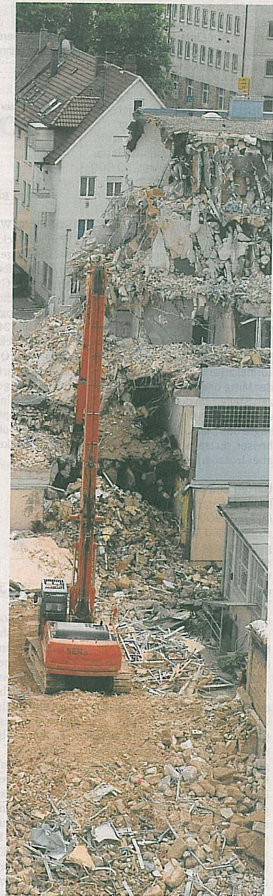
Schutt und nochmals Schutt: In 3000 Lkw-Fuhren werden die 70 000 Tonnen Material abtransportiert.