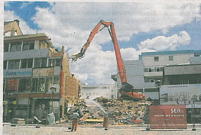
Ausnahmsweise stehen auf diesem Foto keine Zuschauer vor dem Zaun. Denn seit einigen Wochen sind die einstürzenden Bauten die Attraktion für Passanten.