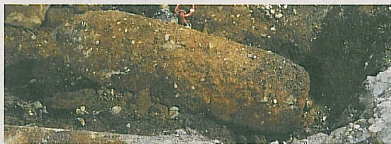
Vor dem Abtransport: Die britische 230-Kilo-Fliegerbombe war von ihrer Umgebung kaum zu unterscheiden. Ihre Entschärfung dauerte nur wenige Minuten.